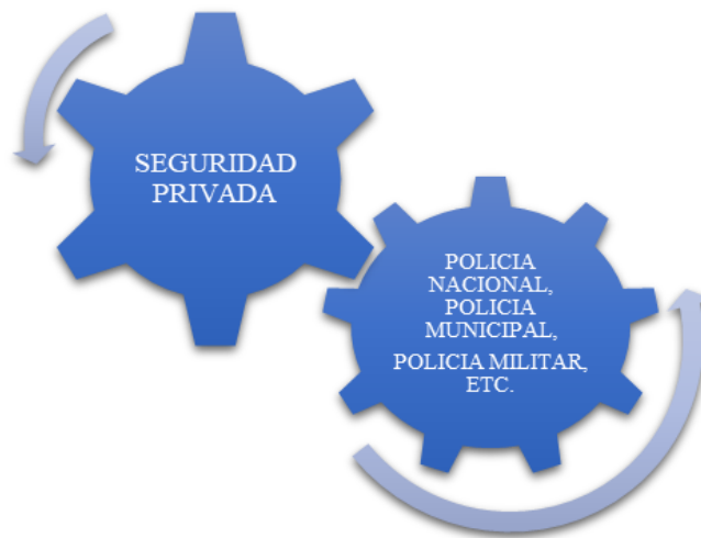
Figura 2. Engranaje de Responsabilidades de las Fuerzas de Seguridad

El procedimiento para solicitar apoyo externo para el Proyecto, la UCP deberá informar y solicitar al Director de la Policía Municipal el apoyo y presencia de los elementos en los lugares de intervención del Proyecto, el cual en su facultad solicitará a las fuerzas amigas como la Policía Nacional, Bomberos y demás la presencia y colaboración para velar por la seguridad de los trabajadores del proyecto, bienes e instalaciones.